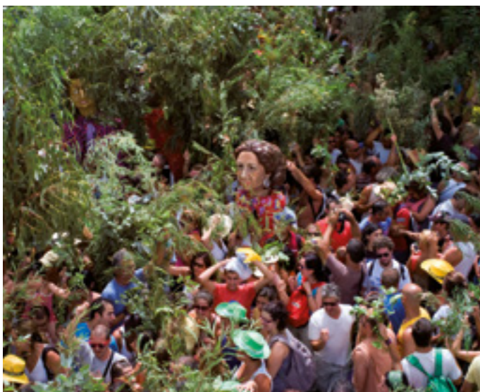
La Bajada de la Rama.

Virgen de la Inmaculada Concepción el 8 de diciembre.