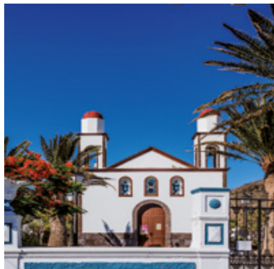
Ermita de Ntra. Sra. de las Nieves.