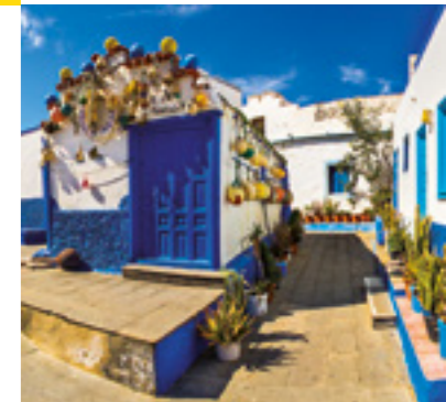
Puerto de Las Nieves.

Es el Valle de Agaete quizás el único lugar de España y Europa donde el cultivo de café tiene cierta entidad; aunque su producción es pequeña, destaca especialmente su calidad: "Es de gran calidad. Tiene un buen color amarillo verdoso. Huele a fruta verde. Tostado, se desarrolla e hincha bien. La bebida resultante tiene un gusto afrutado