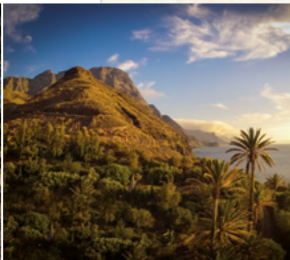
Barranco de Guayedra.