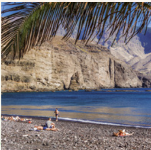
Playa de Las Nieves.