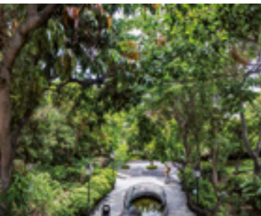
Huerto de las Flores.

La villa marinera de Agaete se encuentra en el noroeste de Gran Canaria, a tan sólo 30 Km de la capital de la isla, Las Palmas de Gran Canaria.