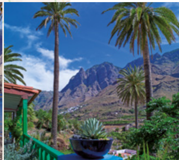
Valle de Agaete.

Parques Naturales de Gran Canaria. El acceso al mismo desde Agaete sólo se puede hacer a pie por los diversos senderos que atraviesan este Valle y que nos conducen por hermosos parajes en las montañas que circundan esta zona de Gran Canaria.